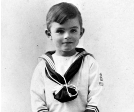
Alan Turing (5 Jahre alt)