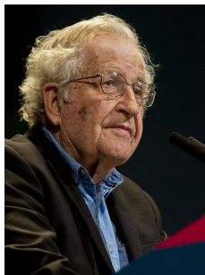
Ministerio de Cultura de la Nación 2015, CC-BY-SA 2.0